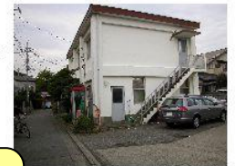
改善ランク A.改善 B.改善が望ましい C.将来改修時に改善