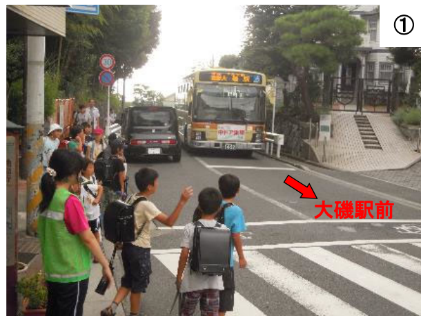
大磯駅前から国道1号方面を望む