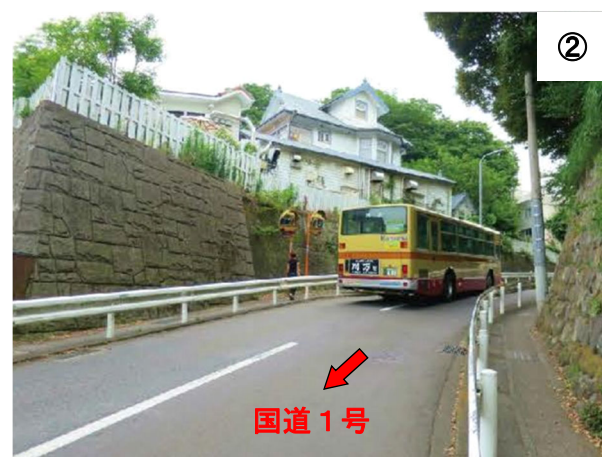
国道1号方面から大磯駅前を望む