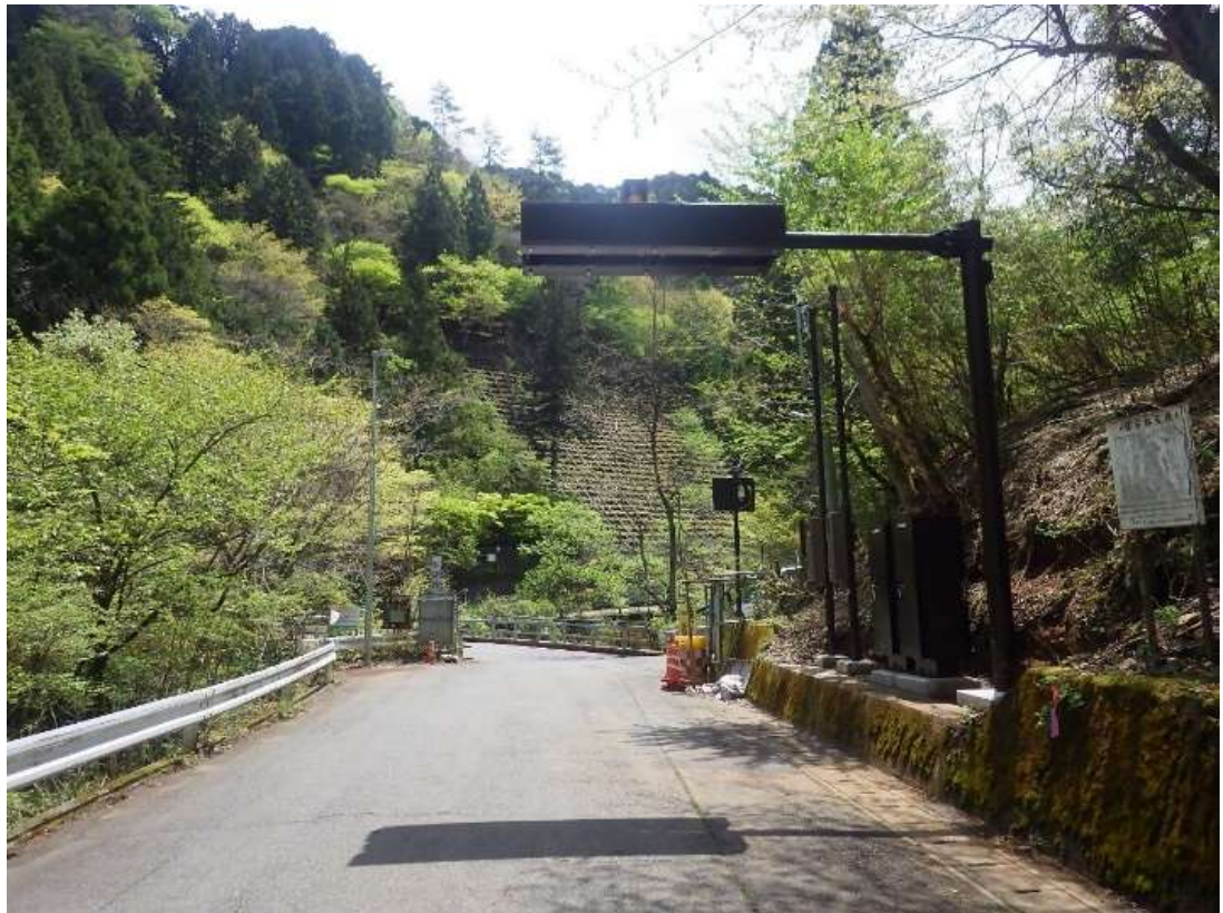
道路情報提供装置を清川村側よりのぞむ