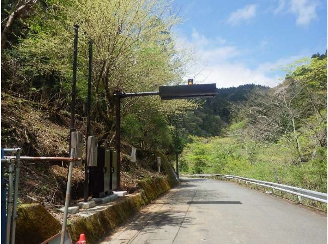
道路情報提供装置を秦野市側よりのぞむ