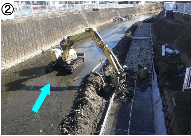
②の写真は、右岸側の根固工の施工状況で、かごマットという鋼製のかごに割栗石を敷詰めている様子です。

※ 現在は、右岸側の根固工を施工しており、設置完了後川の中央部の掘削を行います。