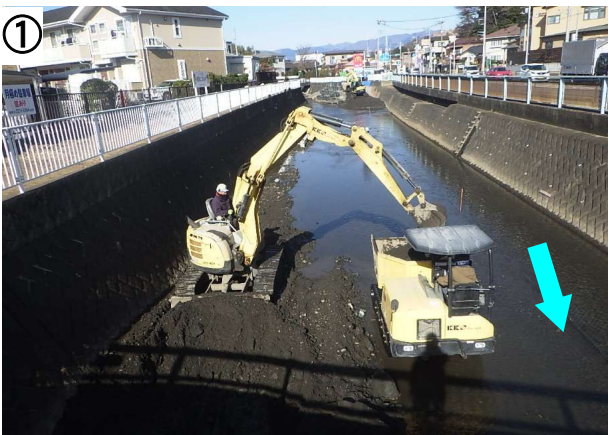
①の写真は、根固工の施工のために河床を掘り下げている様子です。