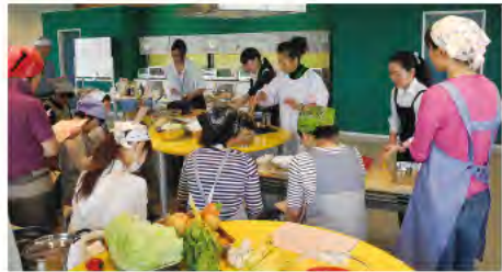
花菜ガーデンで開催された料理教室