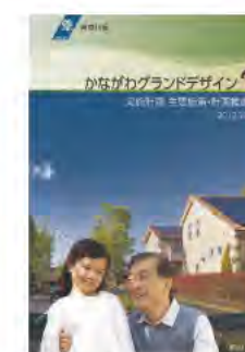
実施計画 主要施策・計画推進編