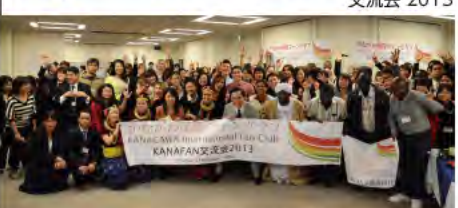
かながわ国際ファンクラブ-KANAFAN交流会 2013