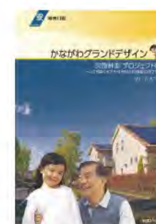
実施計画 プロジェクト編