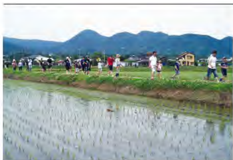
水のさとかながわづくり「開成町水路ウォーク」