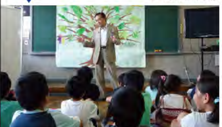
いのちの授業風景