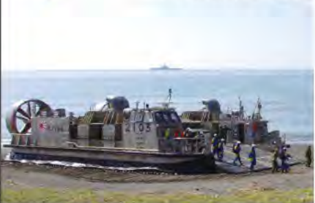
ビッグレスキューかながわ