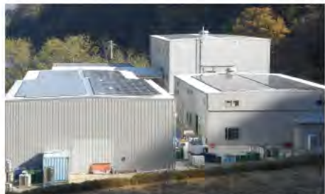
「県内企業における屋根貸し」によるソーラーパネルの設置

全国先駆けとなる先進的な取組みである「神奈川モデル」の最新の取組状況は次のとおりです。 2014年5月までの取組みを記載しています。