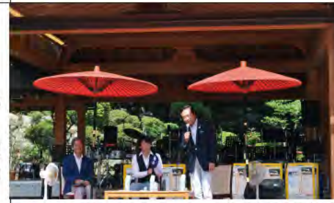
にぎわい拠点づくり 大山キックオフイベント