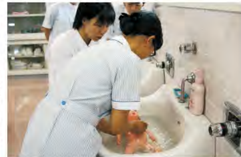
県立看護専門学校での実習