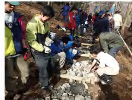
県民と連携した登山道整備