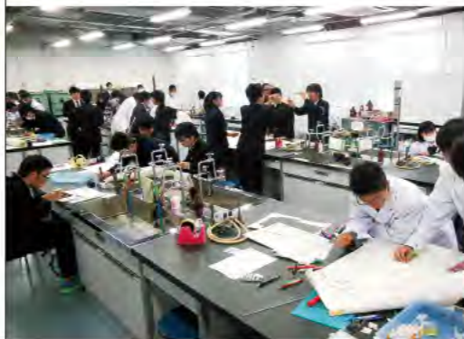
科学の甲子園 神奈川県大会