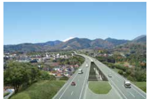
新東名高速道路 パース図

新東名高速道路や横浜湘南道路及び厚木秦野道路(国道246号バイパス)などの整備促進や県道45号(丸子中山茅ヶ崎)[湘南台寒川線]の整備などの道路網の整備を進めていきます。また、スマートインターチェンジや吾妻橋(県道63号(相模原大磯)の整備など道路網の有効活用にも取り組みます。