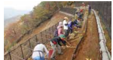
丹沢大山での植樹活動