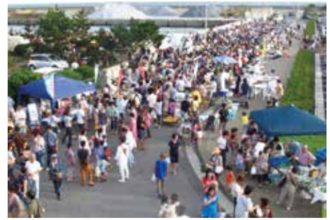
大磯市(おいそいち)

大山・大磯地域については、横浜・鎌倉・箱根に次いで、海外にも強力に発信できる魅力的な国際的観光地の創出に向けて、地域を盛り上げつつ、地元と一体となって、新たな観光の核づくりを進めています。