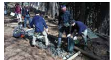
県民協働による登山道整備