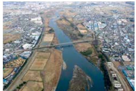
ツインシティ整備地区周辺の状況

再生可能エネルギーの導入など、環境共生モデル都市ツインシティを整備することで、魅力あるまちづくりを推進するとともに、全国や首都圏との交流連携の窓口となる東海道新幹線新駅を設置し、地域全体の活性化を図ります。