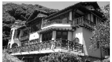
鎌倉文学館 (近代建築物の保全・活用)