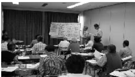
コミュニティビジネス起業講座