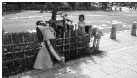
若宮大路さわやかロード (アダプト・プログラム)