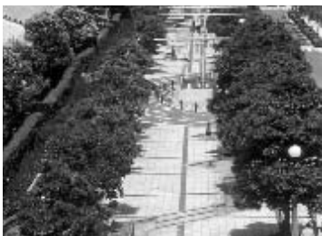
うみかぜの路 (三笠公園)