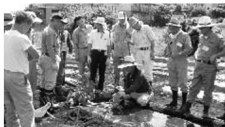
中高年ホームファーマーの育成