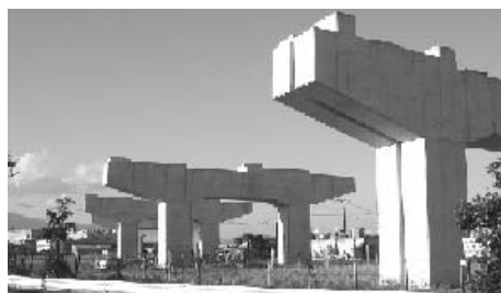
さがみ縦貫道路寒川地区橋脚設置状況