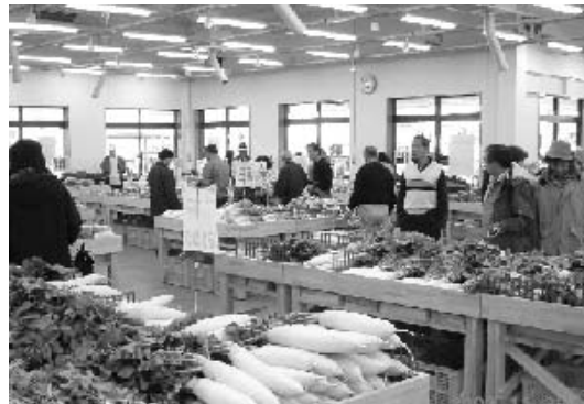
地産地消施設「はだのじばさんず」