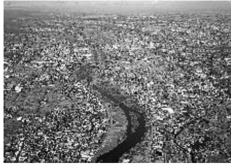
ツインシティ整備地域の遠景