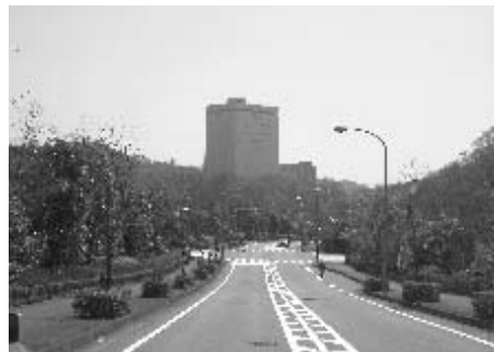
グリーンテクなかい