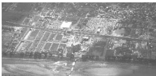
開成駅・酒匂川2号橋建設地周辺