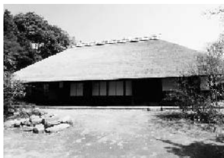
あしがり郷・瀬戸屋敷主屋