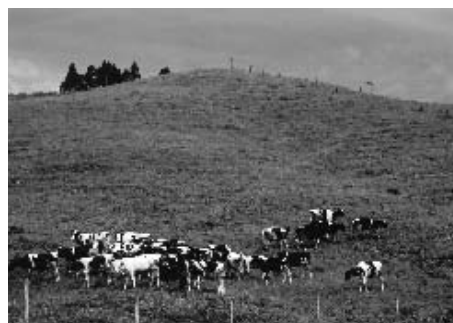
大野山の乳牛放牧風景