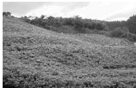
さつきの郷づくり