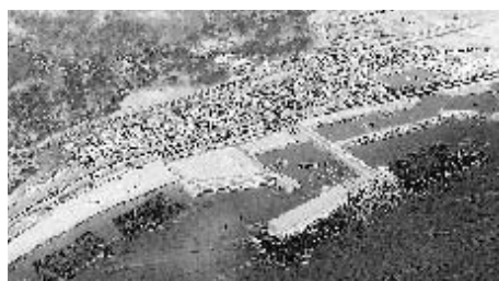
小田原ふれあいの海辺(小田原漁港)イメージ