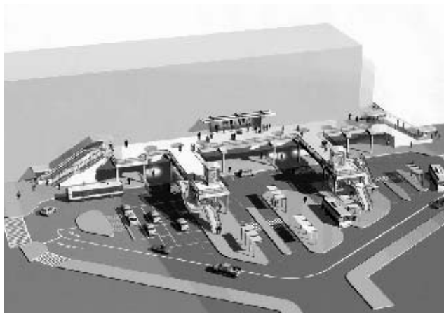
小田原駅東口駅前広場整備