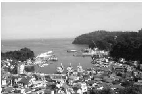
みなとまちづくり(真鶴港)