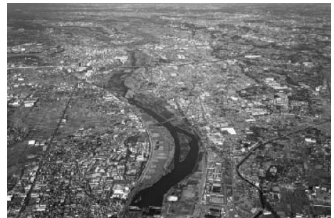
新幹線新駅誘致地区周辺と相模川