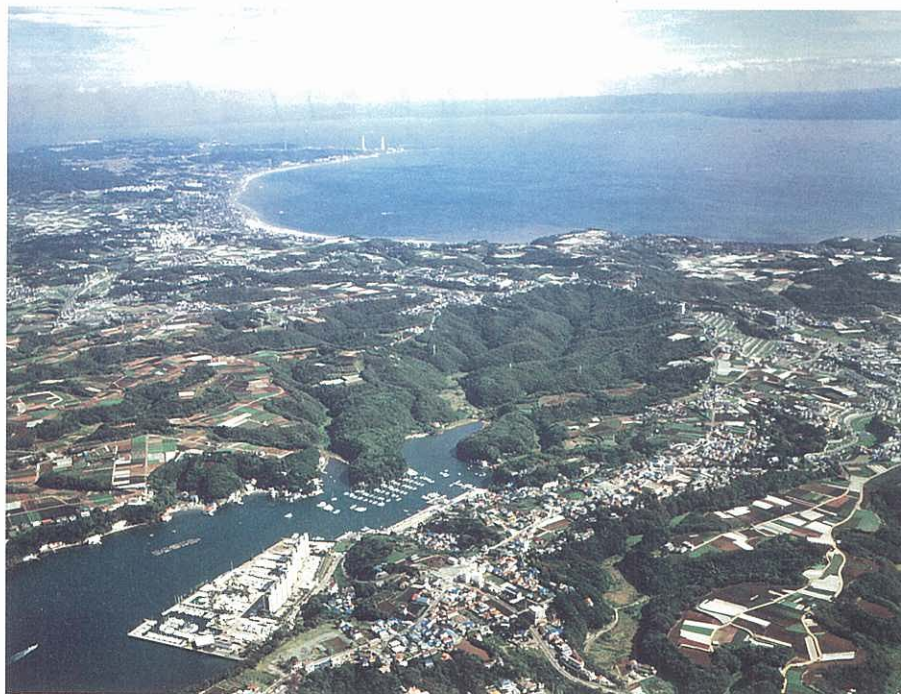
三浦半島・小網代の森