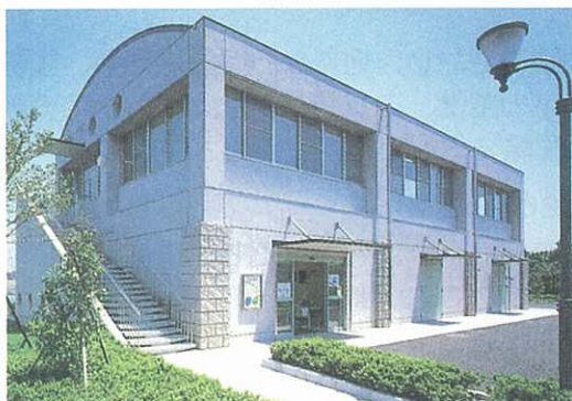
「多摩川エコミュージアム構想」運営拠点・情報センター（二ヶ領せせらぎ館）