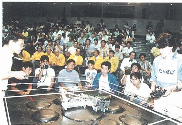
かわさきロボット競技大会