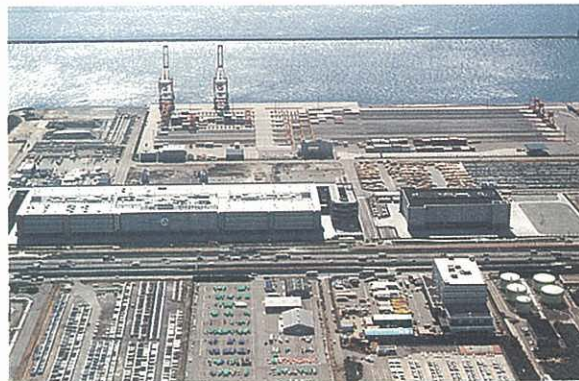
かわさきファズ物流センター (第1期事業)