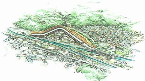
恩廻公園調節池完成予想図