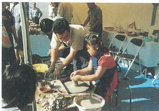
陶器制作実演コーナー（しんゆりアート市）