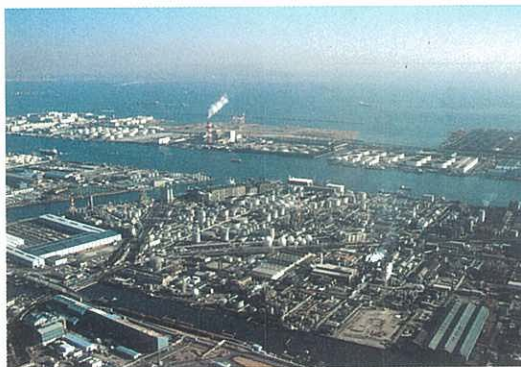
再編整備が待たれる臨海部