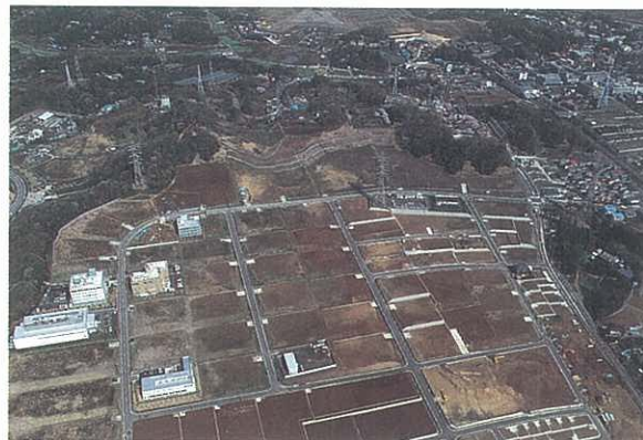
マイコンシティ栗木地区