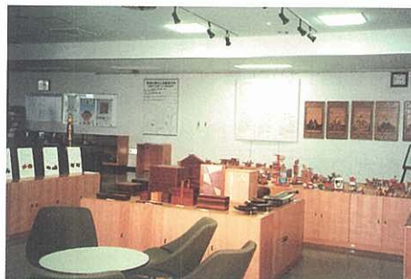
工芸技術センター・木工芸展示