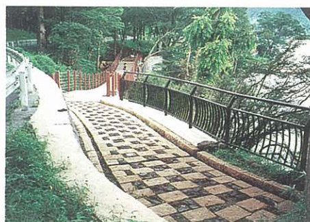
ウォーキングトレイル