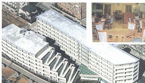
ケア付高齢者住宅の建設促進(相模原市)