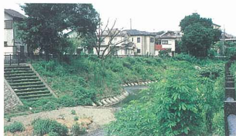
自然にやさしい水辺づくり(境川)