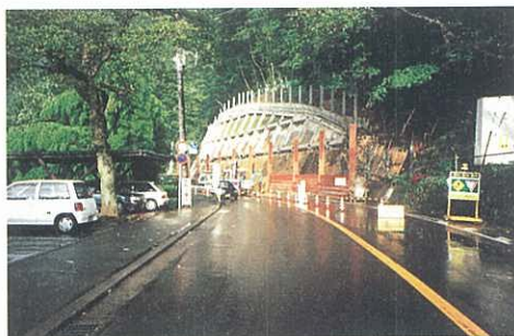
緊急輸送路となる道路の整備（国道412号）