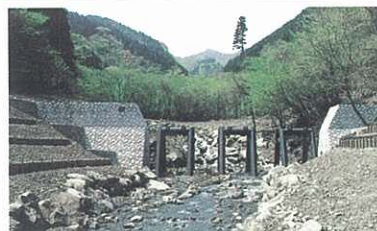
治山事業の推進 (清川村)