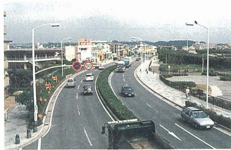
交流幹線道路網の整備（国道134号）