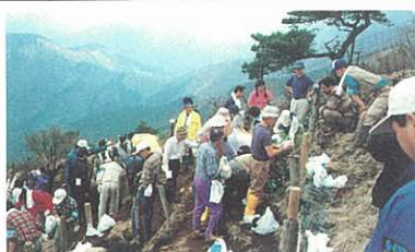
丹沢大山の自然環境の保全 (ボランティアによる植樹活動)