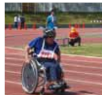
「神奈川県障がい者スポーツ大会」の様子