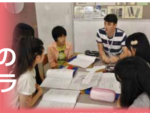
ALT(外国語指導助手)による授業