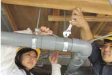
建物施工の職業訓練の様子