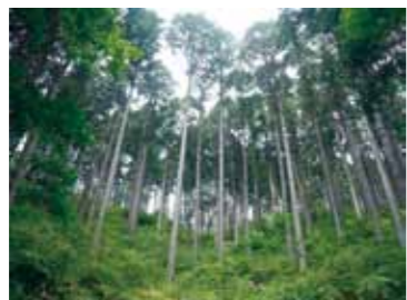
森林整備により回復した下層植生(秦野)