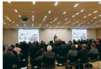
海外での経済セミナー