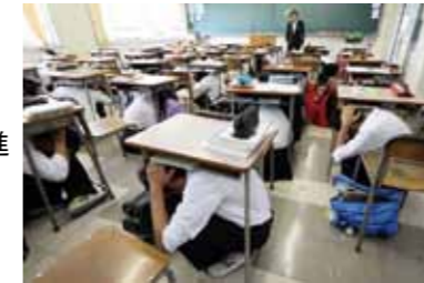
地震発生時の安全確保(シェイクアウト訓練)