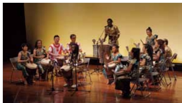
あーすフェスタかながわ