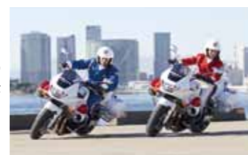
県民の安全・安心を守る白バイの姿