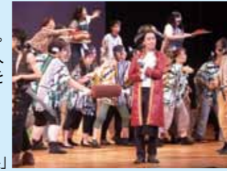
マグカル劇場「青少年のための芝居塾」

「マグネット・カルチャー」の略。神奈川の文化芸術の魅力で人を引きつける、地域の賑わいを創出する取組みです。