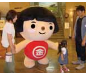
子育て応援キャラクター