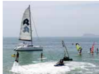
様々なマリンスポーツ