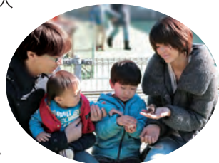
●家族の時間が仕事にも活きる