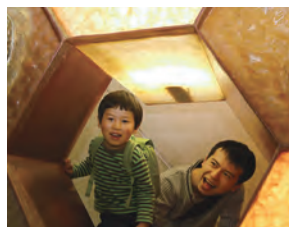
●家族一緒にが活力のもと

ワーク・ライフ・バランスの実現を応援しています。「イクメン」社員の子育てニーズに応じて育児休業や時短勤務の整備、保育負担軽減のための子ども手当の設置など、支援制度を強化し運営してきました。実際に育児休業を利用した男性社員からは「子育て支援制度が充実していたのが入社のも動機です。大切な時期を家族一緒に過ごせました」との感想が寄せられています。