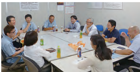
●話し合う場。社内の距離が近い

められる分野で培われた「新しいものを理解する」社風のもと、社長・管理職・一般社員・ユニオン担当らが気軽に話し合う場もあり、そこでの話題が子育て支援にも活かされています。