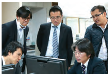
●自主的に技術の勉強

同社は「子育ては自分育て、子育て支援は未来への投資」との考えから、子育てにかかわるイベントにも積極的です。親子のコミュニケーション・スキルを磨く「前向き子育てセミナー『トリプルP』」や、費用は会社負担で家族も参加できる地曳網などを開催。顧客先で個々仕事をする事が多い技術者に、社員同士や家族ぐるみの交流を促しています。