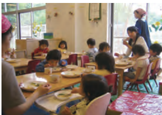
●社内託児所「まーちゃんど」

こうした手厚いサポートは、「育児」というライフイベントがある場合でも希望するキャリアを実現し活躍し続けてほしいとの期待から行っているものです。「2017年に国内の女性管理職比率10%」を目標に、女性リーダーの育成にも積極的に取り組んでいます。