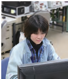
●子育て中も開発を続ける社員

子育て支援では、定時内であれば好きな時間帯を選択できる時短勤務、入社時から積み立ててきた有給休暇を子の看護に使える制度、父になる社員を対象とする妊娠・出産サポート休暇などが充実。育児休業者の復帰時には、本人の希望と制度とを担当者がマッチングして支援。男性の育児取得や午後からの5時間勤務での復職など、多彩な利用法が実現しています。子育て中の社員からは「育児退職という発想はなく、自然体で職場に戻れた」「仕事の優先順位を意識するようになった」「制度を使いやすい雰囲気がある」との声がありました。