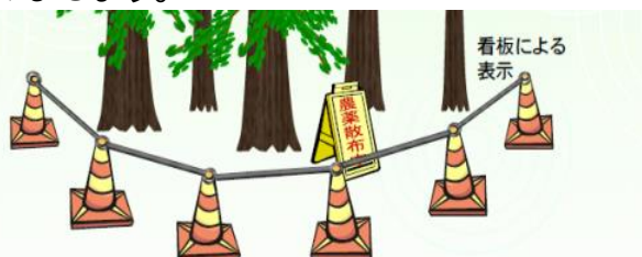
散布区域をコーン等で区分け