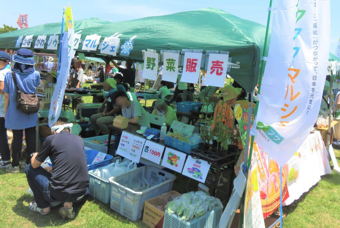
(↑H30年度に実施したかながわノウフクマルシェの様子)