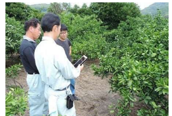
タブレット型端末を用いて農業生産者とミカン果実の肥大を検討