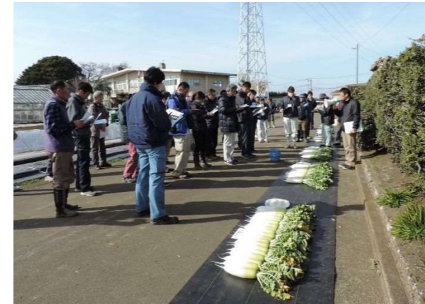
農業生産者とともにダイコンの品種を検討