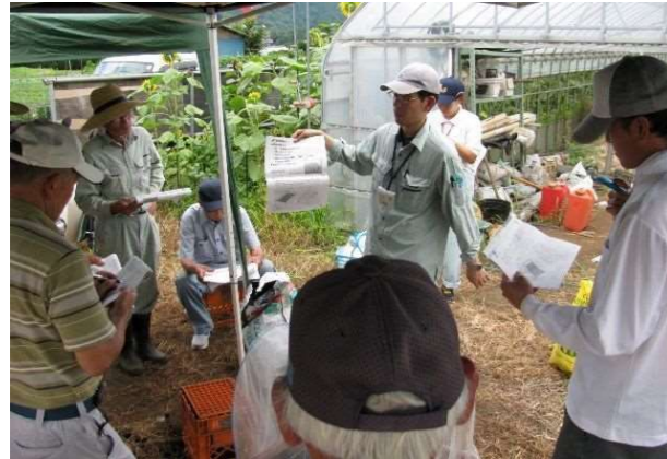
キャベツの播種・育苗について講習を行う普及指導員

普及指導員は、県農業技術センター及び畜産技術センターなどの公的試験研究機関や民間企業で開発された技術、品種、資材や病害虫等に関する知見、他地域の生産動向などの情報を幅広く把握しています。農業技術の専門家として、農業生産者のさまざまなご相談にお応えしています。