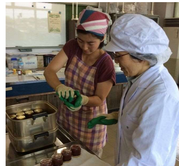
農産物の加工方法を指導