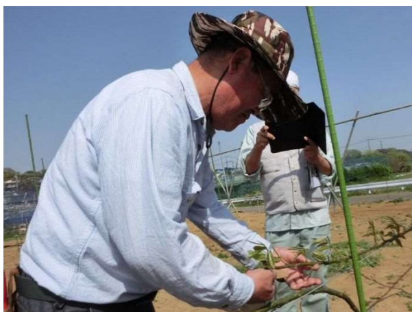
ナシのJVトレリス仕立ての接ぎ木を指導 ※従来のジョイント仕立てより、低い位置で樹の主枝部を連続して接いだ仕立て法