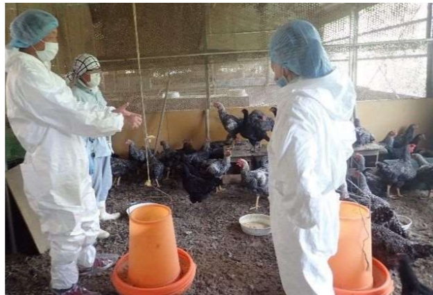
かながわ生まれ、かながわ育ちの肉用鶏、'かながわ鶏' (かながわどり)の飼育管理技術指導