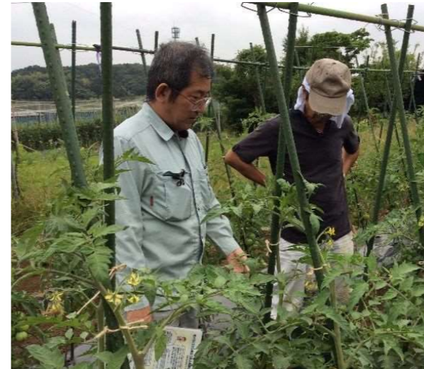
新規就農者を個別に巡回指導