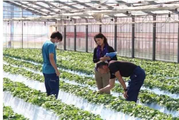
農業生産者へイチゴの技術指導を行う普及指導員