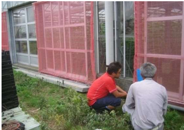
施設キュウリにおける赤ネットを用いたアザミウマの防除効果を農業生産者と検討

農業生産の現場は多様です。既存の農業技術がそのまま適用できるとは限りません。普及指導員は、農業生産者とともに、最新の農業技術を生産現場の状況に合わせて展示・検討し、現場で生じる個別の課題を解決しています。また、研究者へ現場の課題を伝え、解決を促すことにより、的確な試験研究の推進に貢献しています。