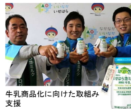
牛乳商品化に向けた取組み支援

普及指導員は、多彩なヒューマン・ネットワークを活かして、農業生産者同士や、研究者、加工業者、農業団体、流通・小売関係者、消費者、行政、その他の分野の方と農業生産者の交流を促進しています。人と人との信頼関係を醸成することにより、地産地消や6次産業化を支援し、地域の活性化を通して、さまざまな課題を解決しています。