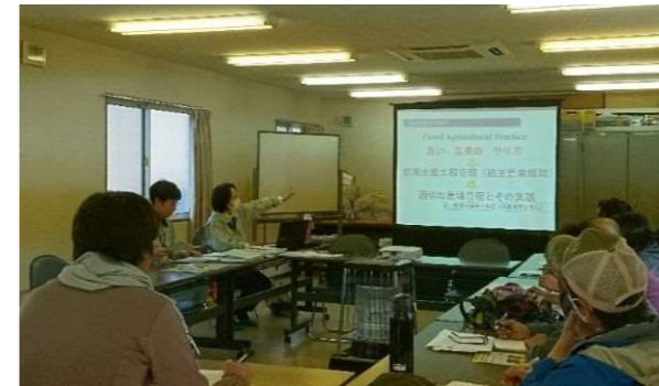
農業生産者を対象としたGAP研修会

※GAP (Good Agricultural Practice:農業生産工程管理) とは、農業において、食品安全、環境保全、労働安全等の持続可能性を確保するための生産工程管理の取組のことです。