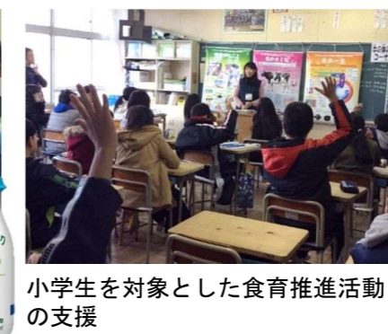
小学生を対象とした食育推進活動の支援