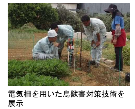
電気柵を用いた鳥獣害対策技術を展示