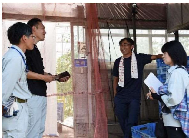
ICTを活用した温室内環境制御法の検討