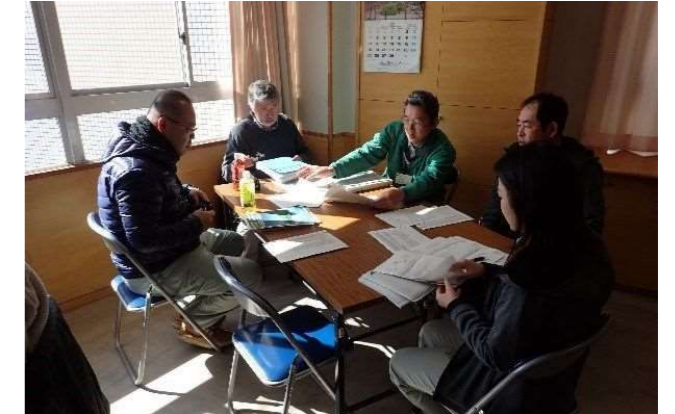
農場HACCP認証取得を目指す法人指導