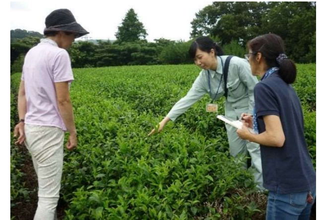
茶の栽培管理について巡回指導