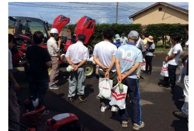
新規就農者を対象とした農作業安全講習会