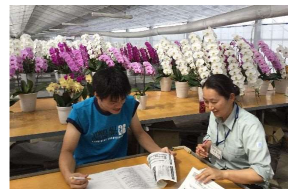
花き生産者への経営管理指導