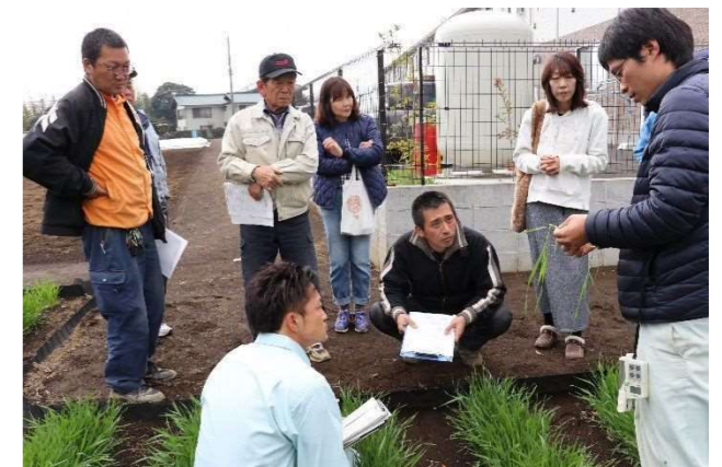
小麦の追肥検討会の様子