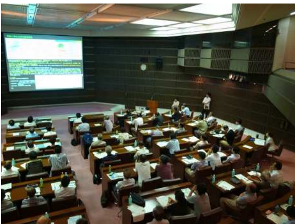
「総合的な評価ワークショップ」会場全体の様子 (横浜市)