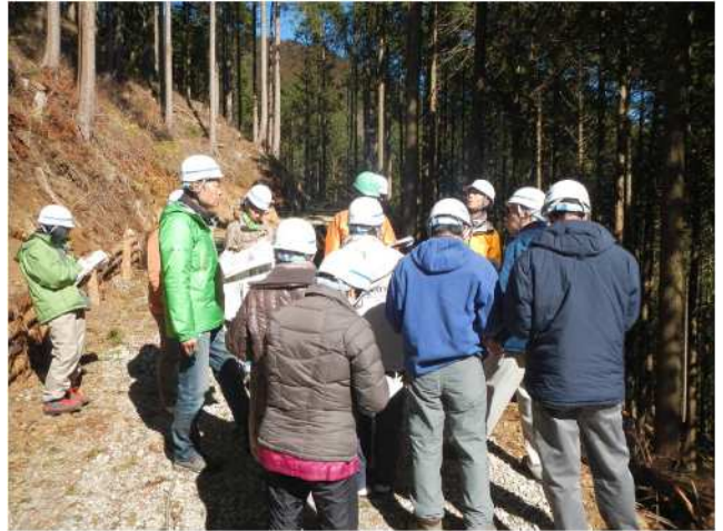
長期施業受委託事業(秦野市)