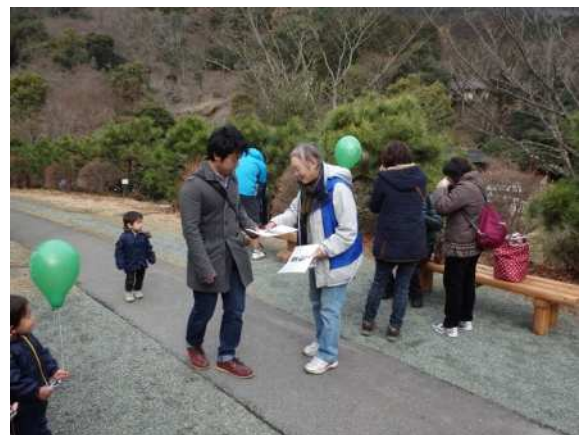
「成長の森植樹会」での来場者への声かけ (県立21世紀の森)