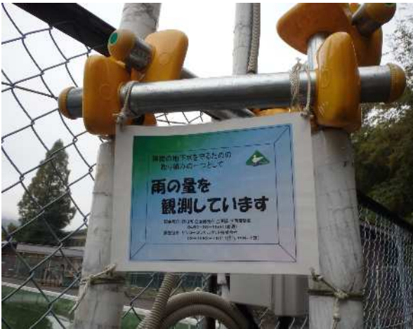
箱根町の地下水モニタリング事業