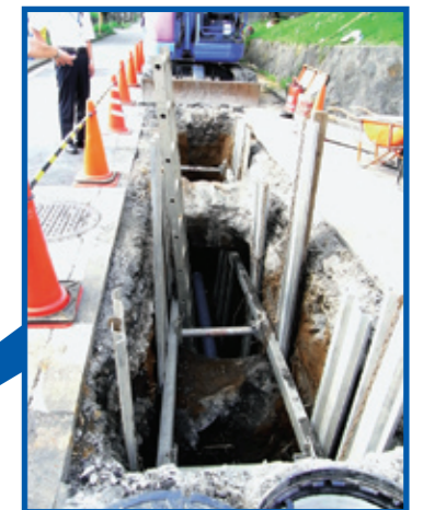
【相模原市津久井町根小屋】