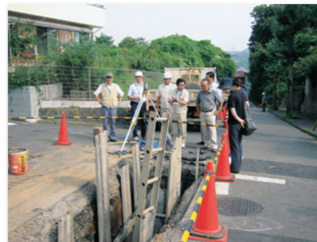
公共下水道の開削工場の現場を視察