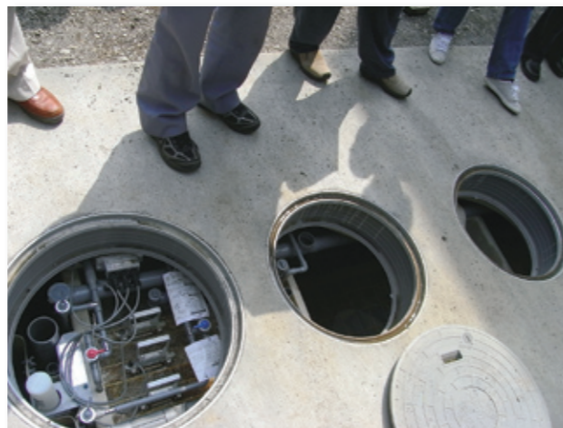
高度処理浄化槽の窒素・リン除去装置の部分を見学