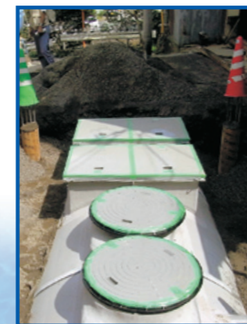
【相模原市藤野町沢井】