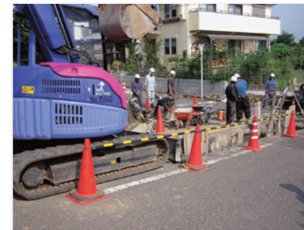
掘削機バックホウで作業も効率よく進む