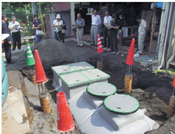
5人槽の必要スペースは縦2.5メートル×横1.3メートル(写真は18人槽)