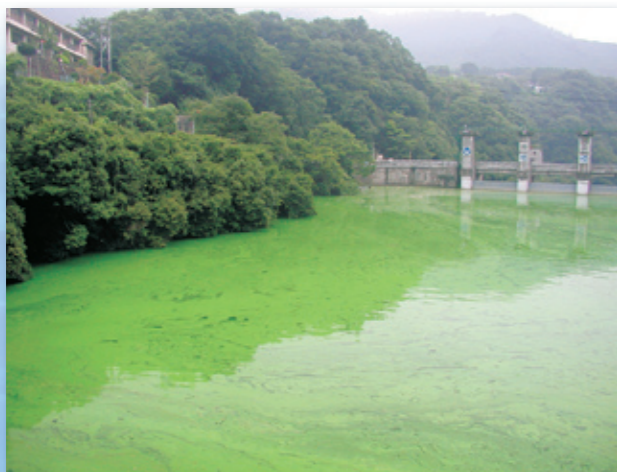
アオコの異常発生(平成18年相模湖)

相模湖・津久井湖は、窒素やリンの濃度が高く、富栄養化状態にあることから、夏にアオコなどが発生しやすい状況にあります。