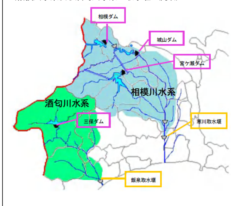
河川モニタリング（動植物等調査）の対象地域 （相模川水系及び酒匂川水系の取水堰上流域）

本調査は、マクロな視点で河川環境を把握していくことにあり、個々の河川対策の実施効果を検証するための調査については、それぞれの事業等で実施するものとする。