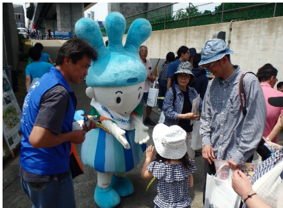
しずくちゃんによるPR