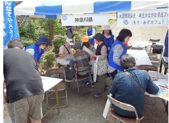
もり・みずカフェブース③