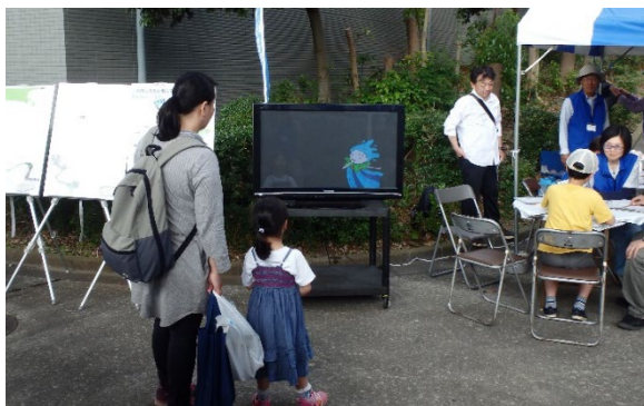
「かながわ しずくちゃんと森のなかまたち」の放映