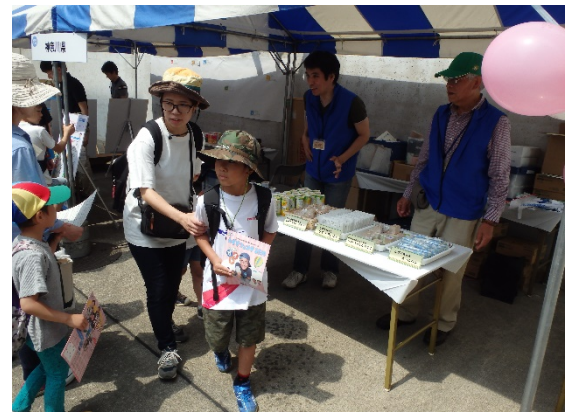
アンケート景品(しずくちゃんグッズ等)の配布