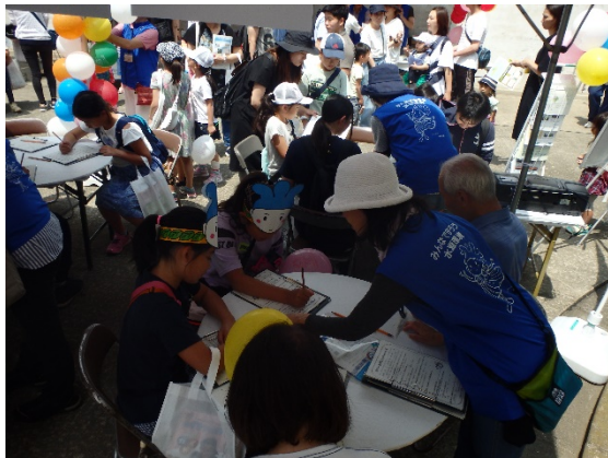
もり・みずカフェブース②