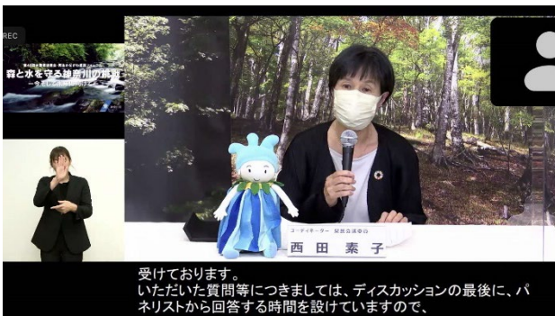
実際の配信画面の様子