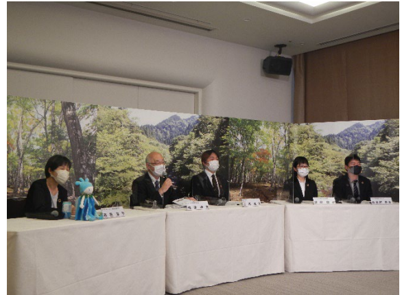
パネルディスカッションの様子