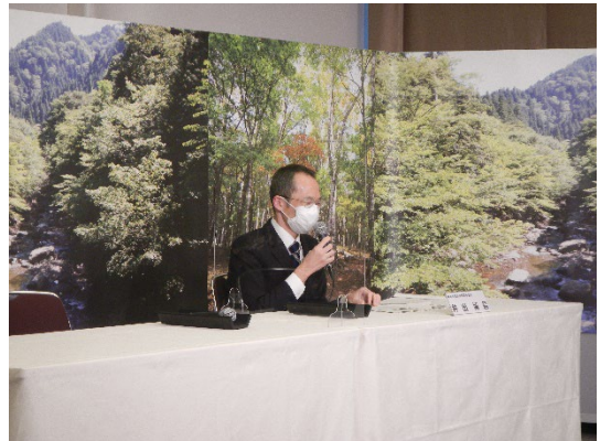
水源環境保全課長による施策紹介の様子