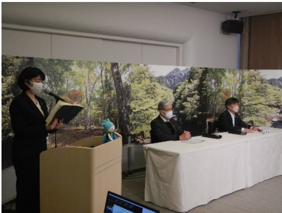
市民活動団体の取組紹介の様子