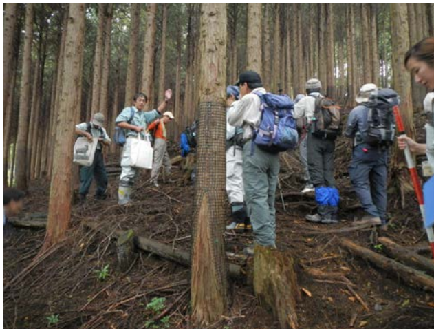
丹沢大山の保全・再生対策（東丹沢地区 天王寺尾根）