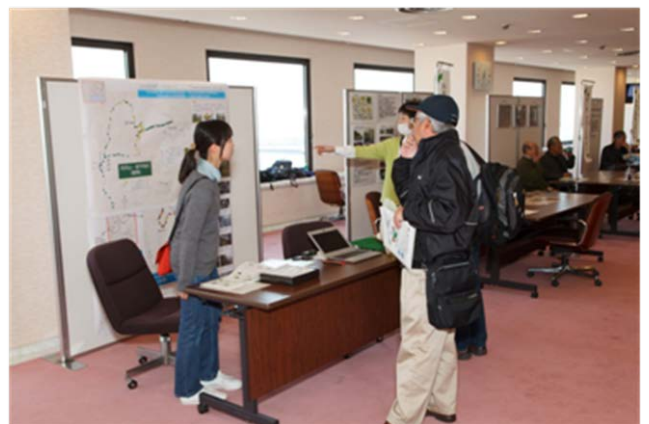
ロビー会場での市民団体の活動展示（横浜市）