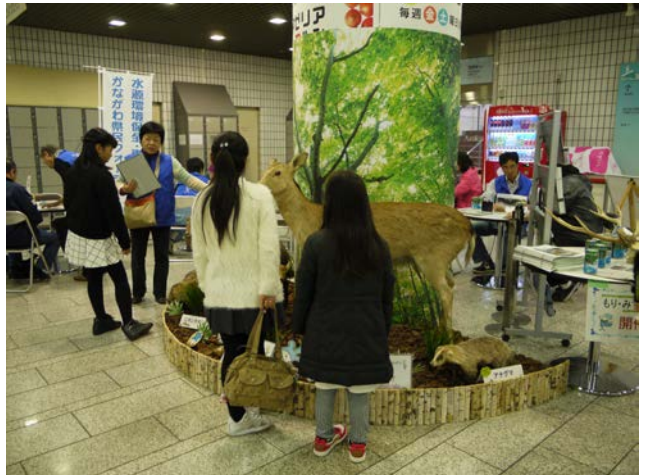
水源地域の動物のはく製展示（川崎市）