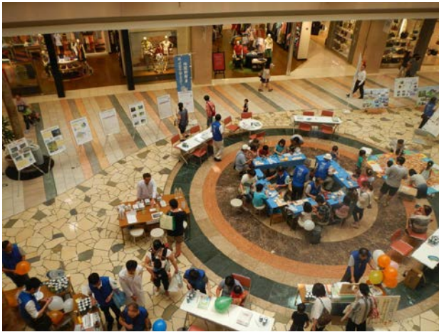
会場全体の様子（小田原市）