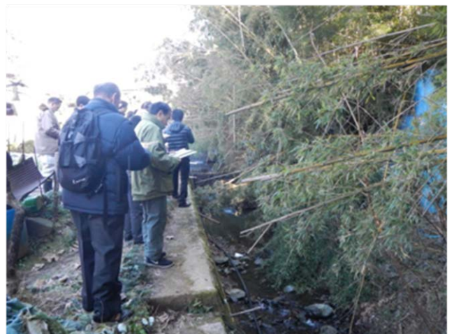
河川・水路における自然浄化対策の推進（松田町寄）