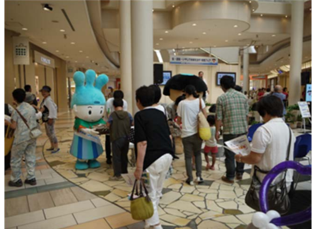
「しずくちゃん」着ぐるみによる広報用リーフレット等の配布（小田原市）