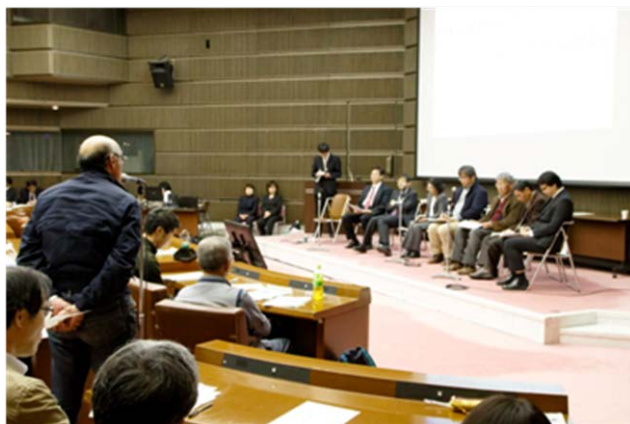
講師・パネリストと参加者との意見交換（横浜市）