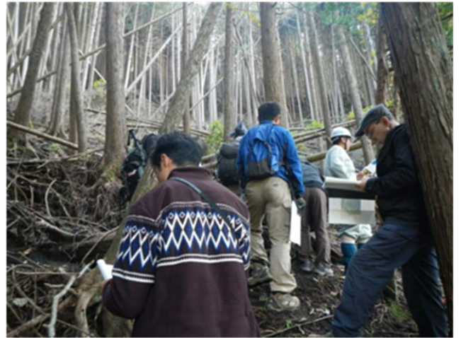
水源の森林づくり事業の推進（山北町神尾田）