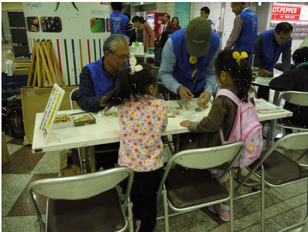
市民団体によるウグイス笛作り体験教室（川崎市）