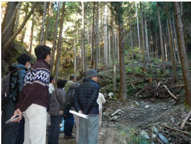
相模川水系上流域対策の推進（山梨県上野原市桐原）