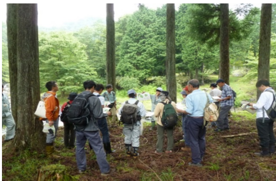
溪畔林整備事業（山北町）