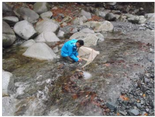
河川の流域における動植物等調査の様子 （玄倉川 ユーシンロッヂ前）