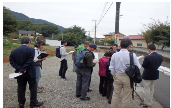
県内ダム集水域における公共下水道の整備促進 （相模原市緑区）