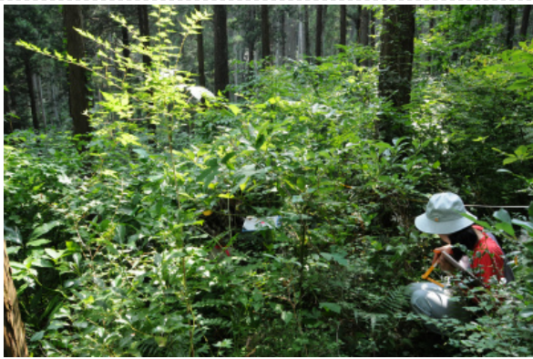
森林生態系効果把握調査の状況（小田原市久野） 箱根外輪山の整備後5年が経過したヒノキ林