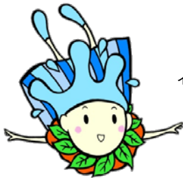
水源環境保全・再生 イメージキャラクター しずくちゃん