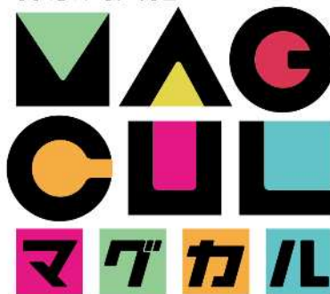
神奈川県文化プログラムのマーク