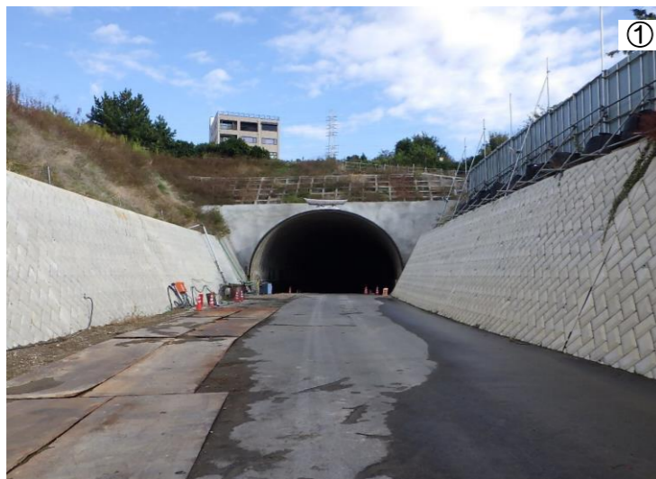
↓ 至 小田原駅