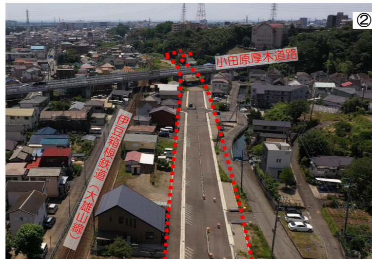
↓ 至 南足柄