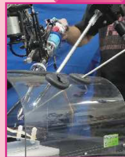
先端回転ロボット鉗子