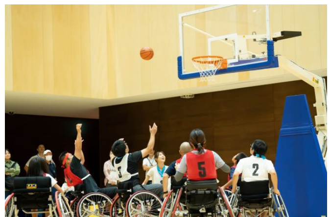
かながわパラスポーツフェスタ (車いすバスケットボール)