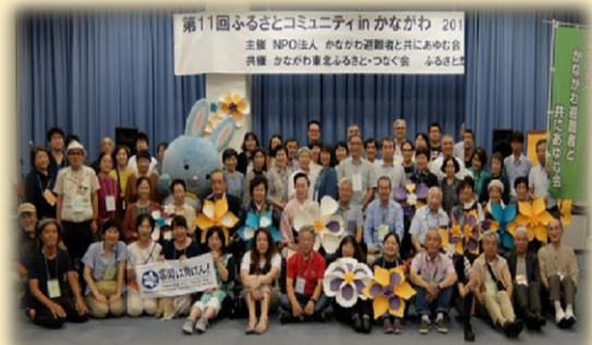
第 11 回ふるさとコミュニティ集合写真(2019 年)

神奈川県基金21事業に災害対策課とボランティア活動推進課との協働事業として採択されて、2013年に「かながわ避難者とともにあゆむ会」ができました。県の協力を仰ぎ、活動に参加希望の方を登録し、各種イベントを企画したり、各種案内を送付したりしました。毎年開催している一番大きなイベントの「ふるさとコミュニティ」は、当初のかながわボランティアネットワークの活動のころから開催しています。そこでは郷土芸能をやってもらえる人の協力があって、それは参加したみなさんに喜んでもらえていると思います。震災直後は被災地の伝統芸能をやっている人が散り散りに避難してしまって活動できていないという声を避難者さんから聞いて、「伝統芸能を復活してもらいたい」「避難者さんに久しぶりに郷土芸能に触れてもらいたい」という思いから、震災で無くなってしまった楽器の調達などいろいろな手配をして横浜で披露してもらいました。