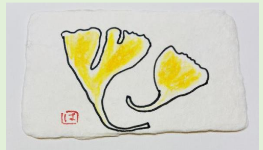
（写真はご本人からいただいたカード）

最近私は家庭菜園をする畑を借りて野菜を栽培しています。採れた野菜は長男や次男のところへ届けに行っています。さらに今年は街路樹の銀杏拾いを始めました。今、横浜は私にとって平和で楽しい場所になりつつあります。菜園での畑仕事も私には初めての事です。周りの人達に教えていただきながら野菜作りを楽しんでいます。災害の時も助けられ、今の菜園作りでも助けていただきながら 10 年目を迎えようとしています。これから人生一日一日を大切に生活していきたいと思えます。