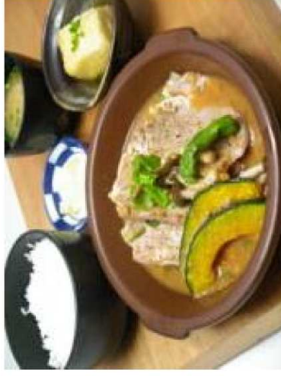
海老名SA(下):高座豚の丹沢味噌煮込み膳

地産地消フェアや県産食材を積極的に展開（現在、海老名SAでは「高座豚」を使用したメニューの提供、中井PAでは「やさい村」で地場産野菜を販売）