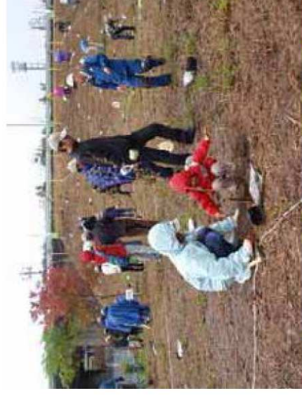
緑の里プロジェクト実施状況