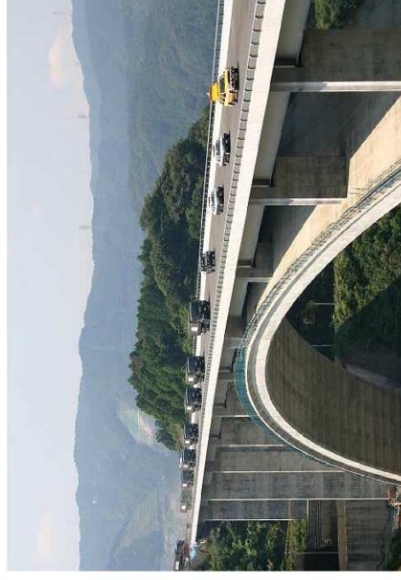
(参考写真)新東名を活用した合同防災訓練