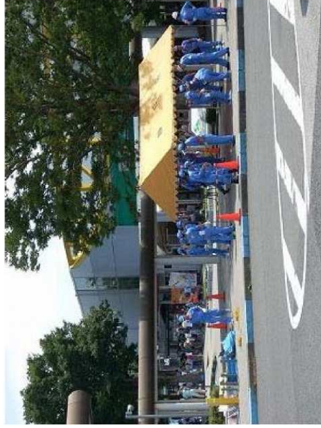
(参考写真)休憩施設の防災拠点としての活用