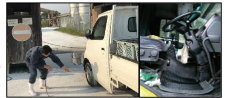
車両はタイヤだけでなく、 泥よけの内側まで消毒 し、 フロアマットの交換 や ペダル等車内も消毒