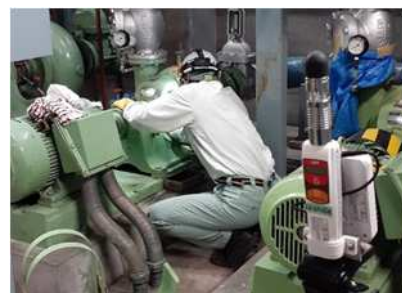
図3 データ取りの様子

気候変動による問題は年々、深刻化しており、過酷な労働現場における熱中症対策や脱炭素化への取組が急務となっている。この研究では、首に装着して頸動脈を冷やす身に着けるエアコンである「ウェアラブルエアコン」を実際の現場労働者に装着してもらい、作業時の生体反応データや暑さの主観評価などを総合的に分析する。更にオフィスでの使用についての実証実験を行い、既存のエアコンの代替手段としての電力削減効果の検証を行う。このウェアラブルエアコンの使用による、効果的な暑さ対策や電力削減効果の検証を行う。