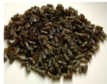
図6 さつまいものつるを利用したバイオプラスチック

地球規模での資源・廃棄物制約や海洋プラスチックごみ問題が注目される中、バイオプラスチックの実用性向上による石油由来プラスチックの代替促進が期待されている。研究初年度となる令和5年度は、梨の剪定枝とさつまいものつるを利用し、ヘミセルローズ抽出条件等の検討を行い、バイオプラスチックを作製した。今後は、バイオプラスチックの土中及び海洋生分解性を検証し、石油由来製品からの代替促進を目指す。「未利用・廃棄植物由来バイオプラスチック」を開発し、石油由来プラスチックを代替することで、CO 2 排出量を削減する。