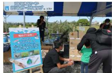
図7 みなと祭り出展の様子

海の環境は、海洋プラスチックごみや温暖化などの影響を受け、大きく変化しているが、その実態が広く市民に知られていない。この研究では、東扇島東公園周辺海域において、潜水での海洋プラスチックごみの実態把握や海洋温暖化による影響の調査を実施し、環境イベントや出前講座を通じてその結果を発信する。身近な海の魅力を伝えていくとともに、環境意識の向上とプラスチックに対する市民への行動変容を促す。