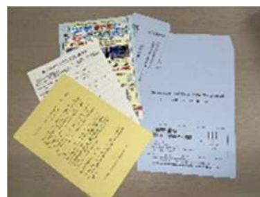
図4 送付した調査票

気候変動による気温上昇が問題とされる中、高齢者の熱中症対策は重要となっている。この研究では、市内の高齢者に対するアンケート調査とそのデータ解析（回答者の属性、被害の有無、対策の実施状況）を通じて、熱中症に脆弱な人々や環境を特定し、効果的な対策方法を見出す。住居内環境の実測を通じて、熱中症発生要因の特定とエアコンを含む実効的な対策の設計を目指す。