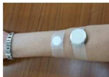
図5 腕に装着した皮膚ガス採取キット

街路樹や公園緑地などの「みどり」が日々の生活において重要な役割を担っているが、その「みどり」がもたらすメリットはや効用はどの程度なのかが明確でない。「みどり」がもたらす効用としてヒトの健康・快適性に着目し、その評価に生体試料として「皮膚ガス」を用いたストレス軽減効果の検証を行う。得られた科学的知見に基づき、多くの市民が改めて「みどり」の価値を認識できることを目指す。