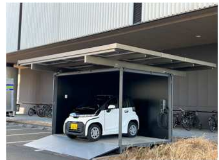
図1 カーシェア拠点 (LiSE 駐車場)

市内の交通部門における脱炭素を推し進めるため、次世代自動車等の導入促進や各インフラにおける拠点整備等が急務となっている。この研究では、再生可能エネルギーを由来とする電力を活用したEVカーシェア拠点を市内各地に設置し、「CO 2 排出量の少ない交通手段の提供」と「次世代自動車の導入・活用」を進める。本実証実験を通じて削減されたCO 2 の見える化を図ることで、市民への行動変容を促す。