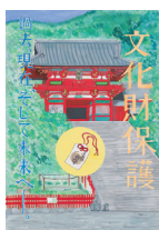
鶴岡八幡宮 本宮 (鎌倉市)