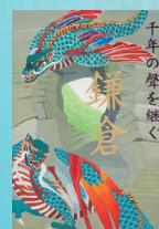
妙本寺・二天門 鳴き龍 釈迦堂切通し(鎌倉市)