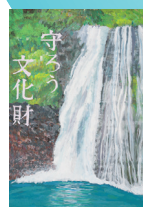
白糸の滝 (静岡県富士宮市)