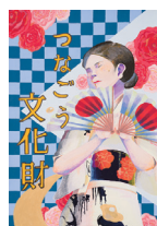
足柄ささら踊り (南足柄市)