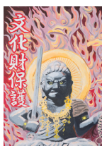
鉄造不動明王坐像 (伊勢原市)