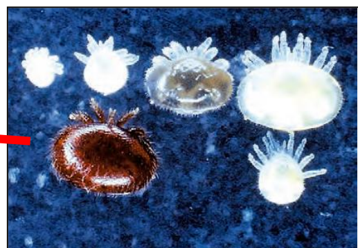
ミツバチヘギイタダニ