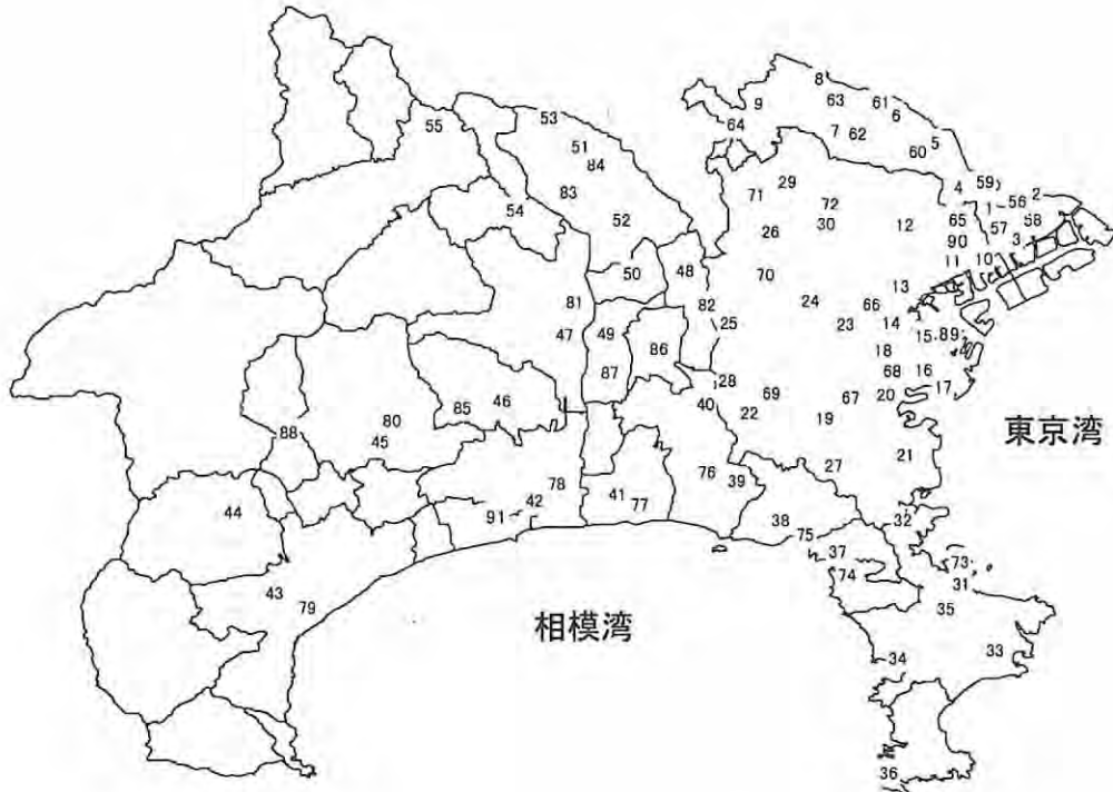
一般環境大気測定局