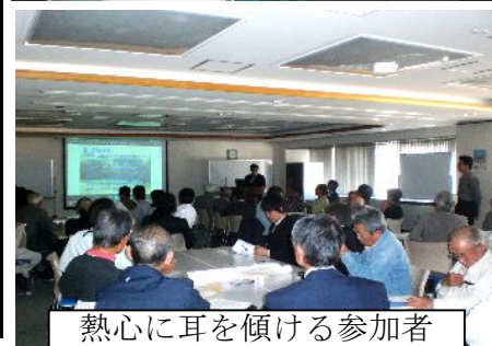
熱心に耳を傾ける参加者