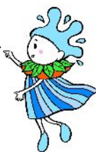
水源環境保全再生 イメージキャラクター しずくちゃん