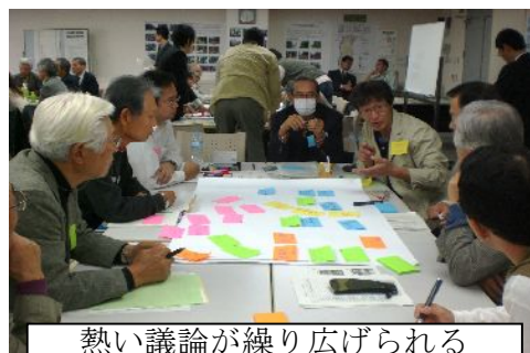
熱い議論が繰り広げられる