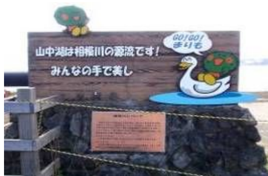
～相模川の源流である山中湖を見学～