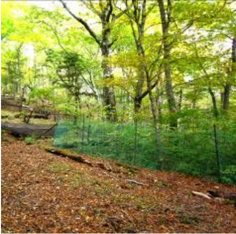
～植生保護柵の内と外は別世界～

〈モニター事業の概要〉 ●モニター実施日 平成21年10月16日 金曜日 ●モニター箇所 堂平・丹沢山 ●かながわ水源環境保全・再生実行5か年計画での位置付け ○特別対策事業2「丹沢大山の保全・再生対策」 【ねらい】 水源保全上重要な丹沢大山について、シカの採食圧や土壌流出等による植生の衰退防止を図るため、新たな土壌流出防止対策を講じることで、森林の保全・再生を図る。