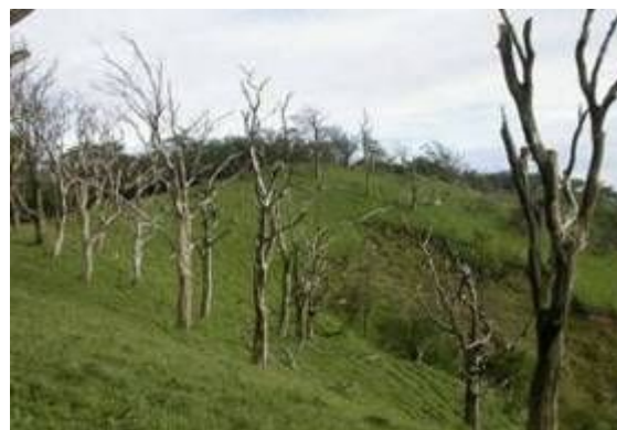
～立ち枯れするブナ～

気象・大気の調査やブナハバチの調査等、長い時間を要するが、継続的な調査が必要な事業である。今後は、調査結果を蓄積するとともに、中期的に解析・評価を行い、ブナ林の保全対策に反映させることが課題である。