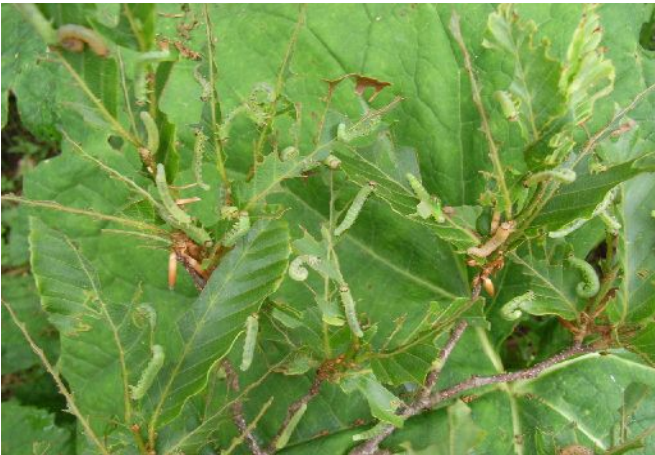
～大発生したブナハバチの幼虫がブナの葉を食い荒らすことでブナに甚大な被害が生じる～