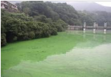
～アオコの異常発生（相模湖）～

相模湖・津久井湖は、窒素やリンの濃度が高い富栄養化状態にあり、夏にアオコの発生が見られます。