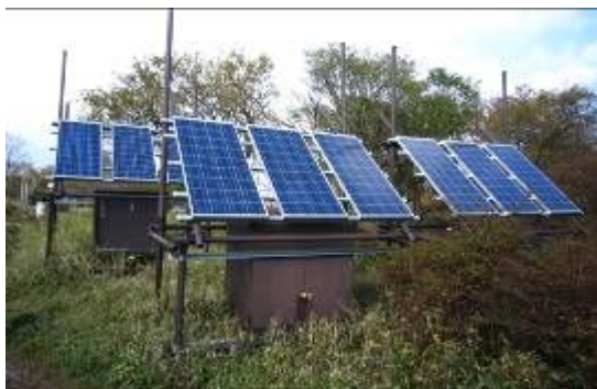
～丹沢山の気象・大気観測装置～

A；ブナ林衰退は、①大気汚染②ブナハバチの大発生③水分ストレスなどの複合的な被害が原因と考えられています。そのため、オゾン濃度の測定とそのデータ解析（ブナ林に悪影響とされるオゾン濃度40ppbを超えている）やブナハバチ発生動向の把握調査（今年は発生が少なかった）など、ブナ林衰退のメカニズム解明を進めています。