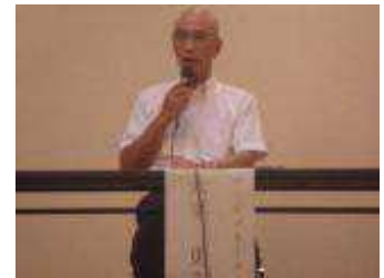
コーディネーター (木平委員)