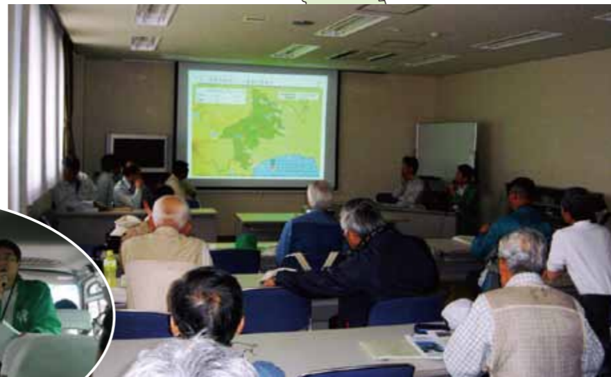
▲事業説明と意見交換