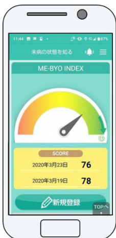
未病指標結果画面

※ 未病指標・・・自分が「健康」と「病気」のグラデーションのどこにいるのか、生活習慣、認知機能、生活機能、メンタルヘルス・ストレスの4つの領域から、現在の未病の状態を数値等で見える化するもの。