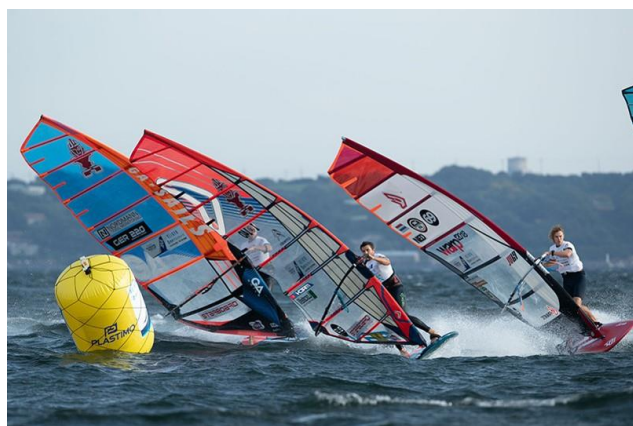
ウインドサーフィンワールドカップ