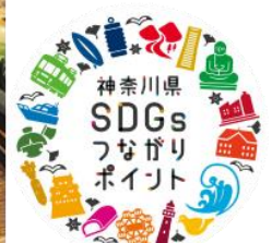
④ SDGsつながりポイント (ポイントと売れ残りパンとの交換)

問合せ先 政策局いのち・未来戦略本部室 SDGs推進担当課長 湊 電話 045-285-1052