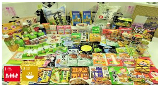
① SDGsアクション加速化促進 (フードドライブ活動)