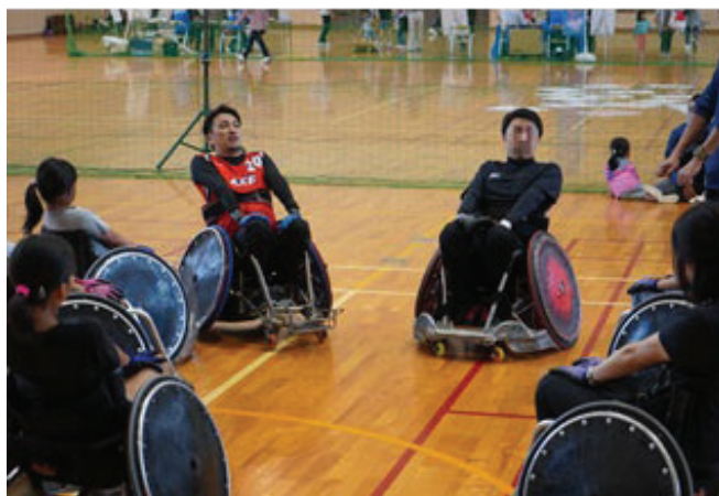
車いすラグビー体験会