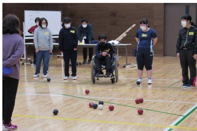
障がい者スポーツ教室(ボッチャ)