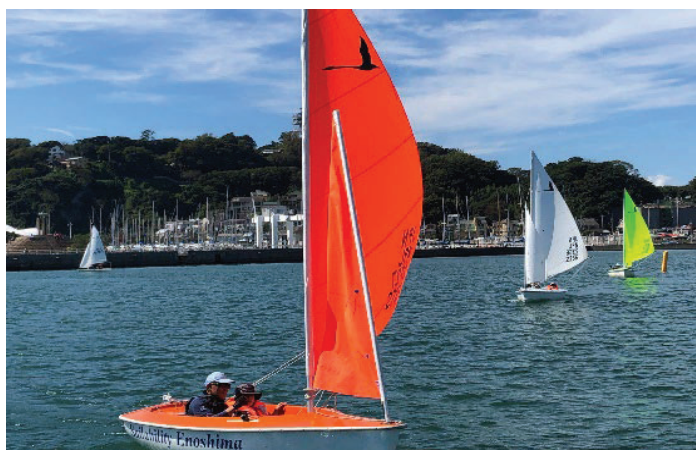
セーリング体験会の様子