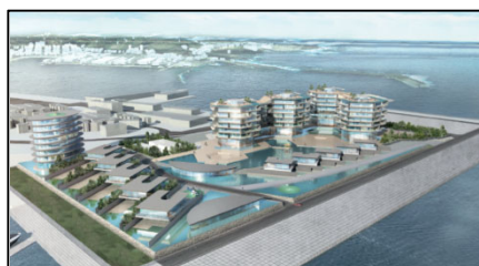
城ヶ島・三崎地域 整備後の二町谷地区 (全体イメージ)