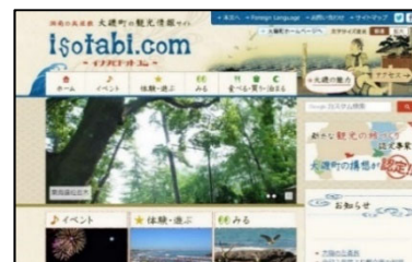
大磯地域 現行の観光ウェブサイト