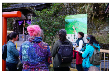
大山地域 地域通訳案内士 (イメージ)