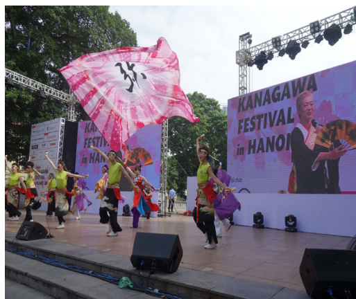
⑩KANAGAWA FESTIVAL in HANOI