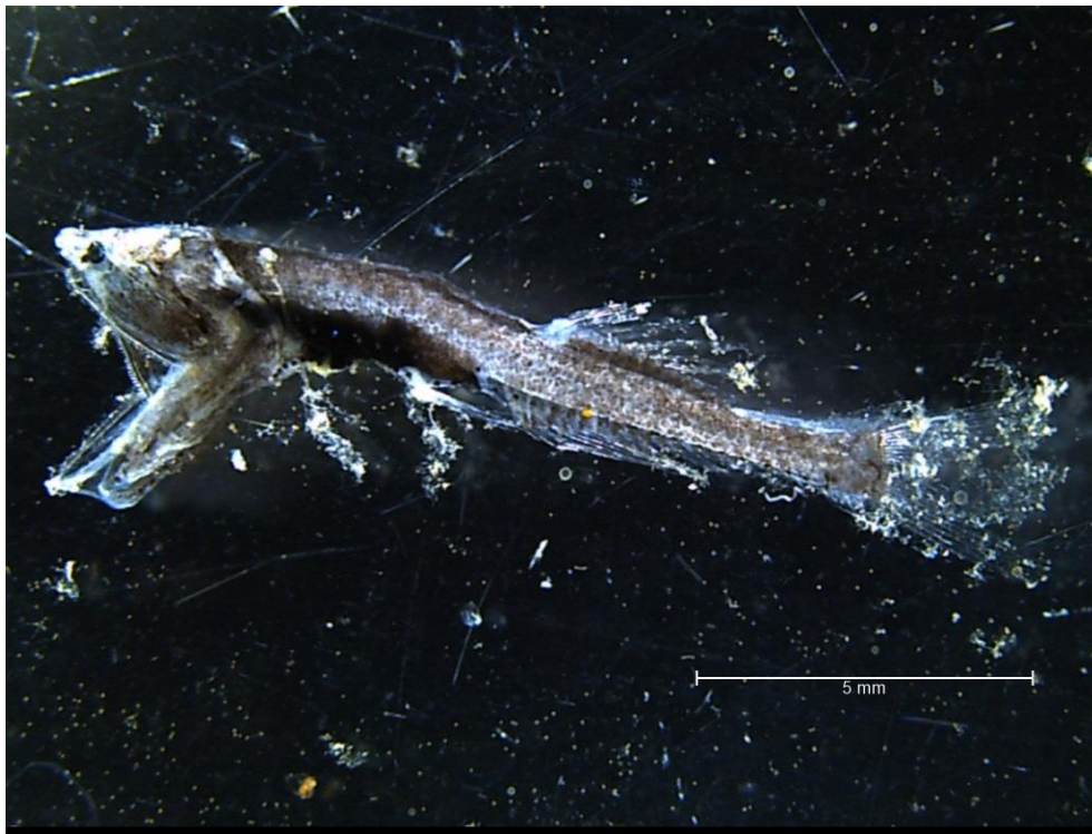
ウスオニハダカ Cyclothone pallida

私たちの身近な相模湾。食べる魚も見る魚も多様性に富んだ海です。 そして、生物にとって一見過酷と思われる深海でも、このように懸命に生きている生物がいる事、自らの目で確認できました。 山田先生、貴重な経験、ありがとうございました。