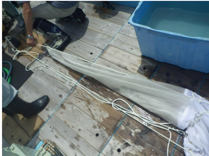
写真：閉鎖式プランクトンネット

表層から順に今回は、0～30m, 30～100m, 100～300m, 300～500m の4層でプランクトン採集をします。プランクトンの採集には、「閉鎖式プランクトンネット（目合い 330 \mu\text{m} ）」という、こちらの大きなプランクトンネットを使用します。（*1 \mu\text{m} =1/1000 mm）