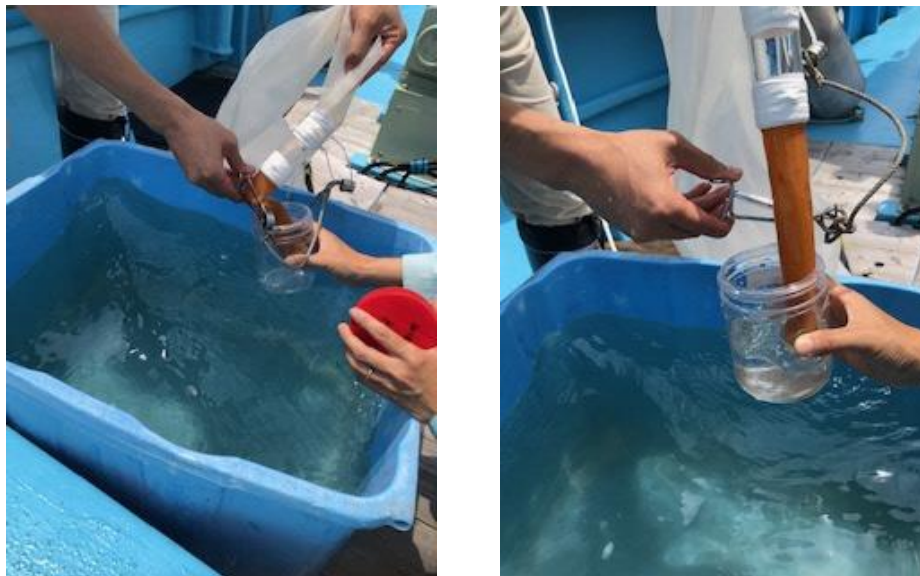
写真：採集したプランクトンを収集する様子

まずは、表層～30mのプランクトンを採集。続いて100m、300mまで深度を下げ、最後に500mまでネットを下ろし、深海のプランクトンを採集しました。