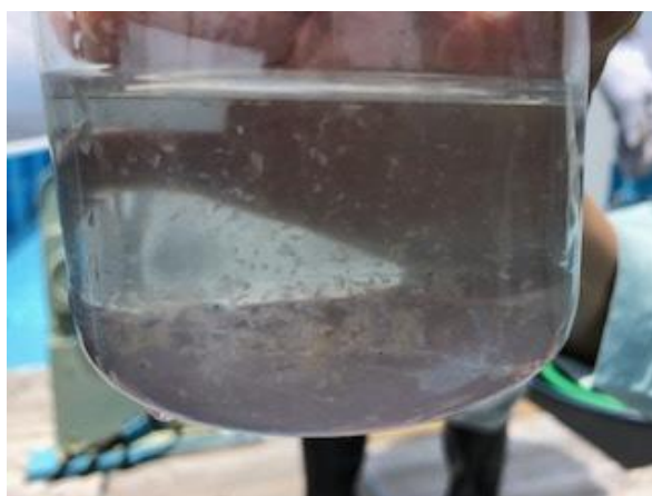
写真：採集したプランクトン（100～300m）