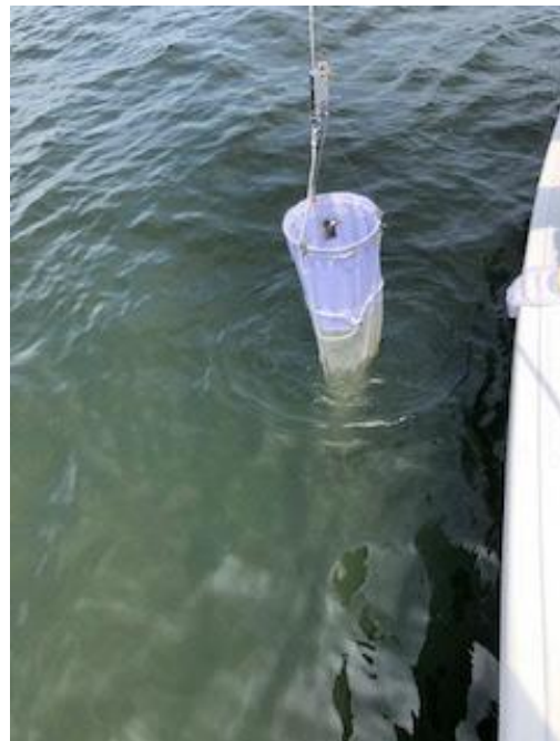
写真：プランクトンネットを下げる様子