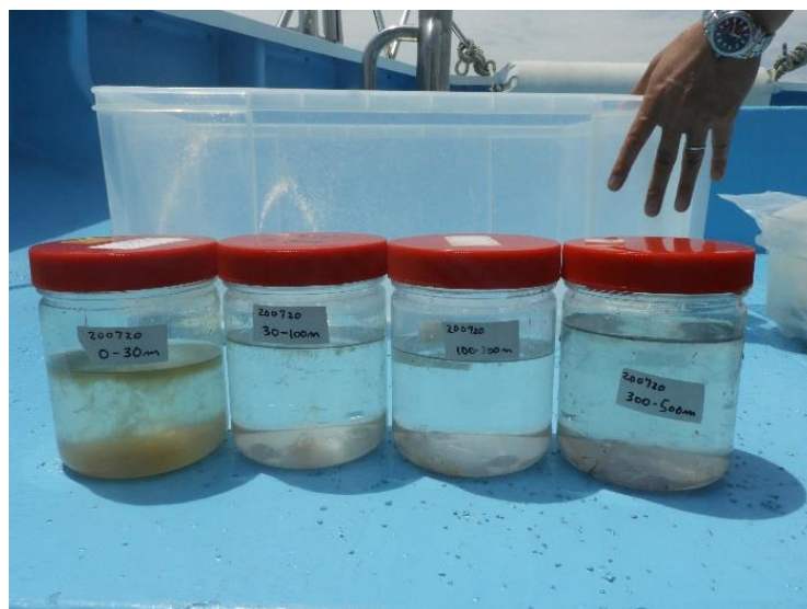
写真：プランクトンの採集結果（左より 0～30m, 30～100m, 100～300m, 300～500m）