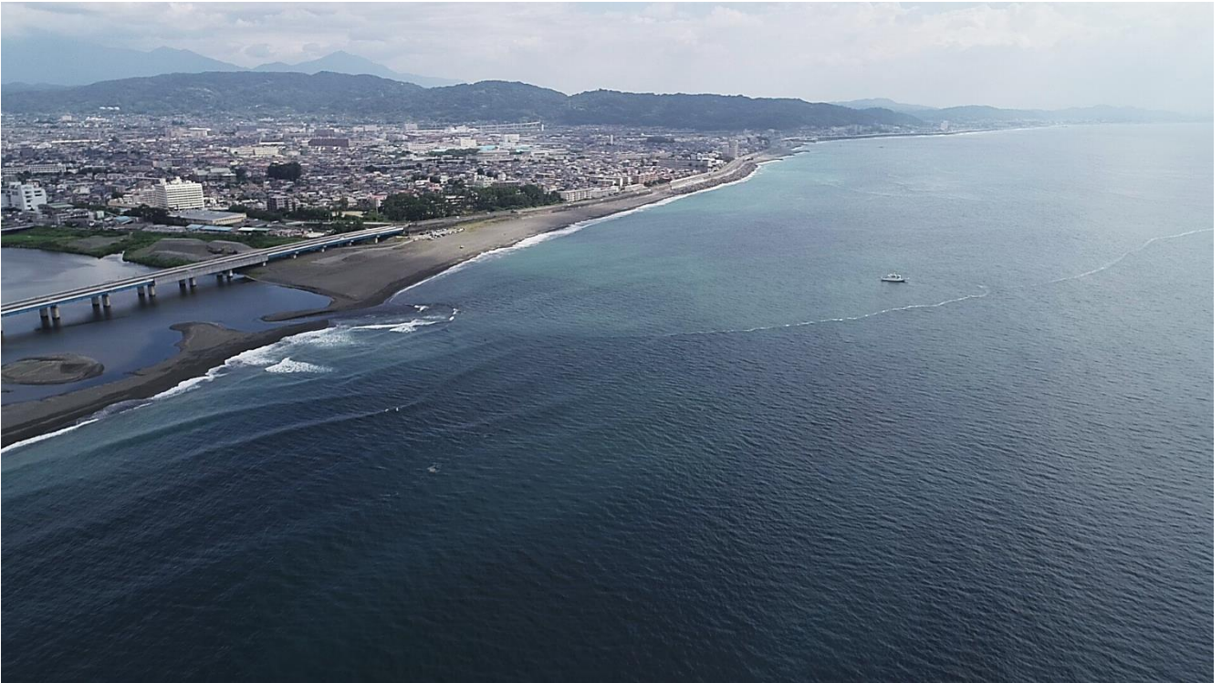
図2 「ほうじょう」と潮目