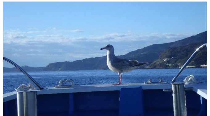
図3、図4 「ほうじょう」で日向ぼっこしているカモメ

私達が調査を行っている最中カモメが「ほうじょう」に羽を休めに来てくれました！！（図3、図4）