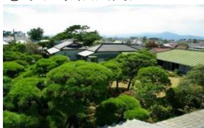
⑧・⑨大磯城山公園（公共）