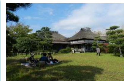
②山口蓬春記念館（民間）