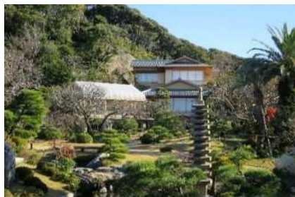
⑧・⑨大磯城山公園（公共）