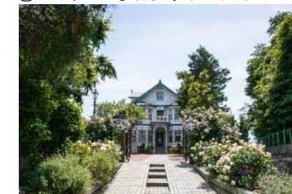
⑪旧木下家別邸（公共）