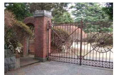
⑥侯野別邸庭園（公共）