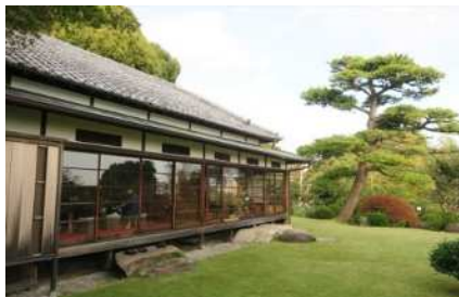
⑬小田原文学館本館（公共）