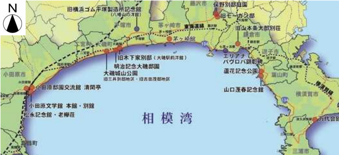
⑩明治記念大磯邸園（整備中・公共）