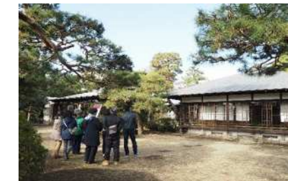
⑪旧木下家別邸（公共）