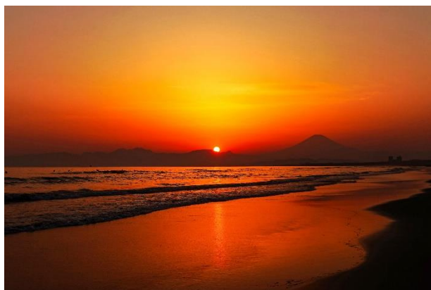
3月号「夕焼け空を映すビーチ」