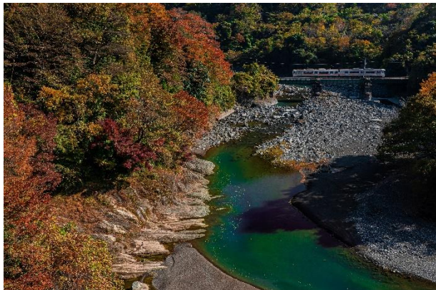
11月号「鮎沢川が織り成す溪谷美」