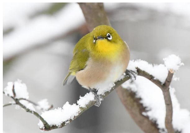
1月号「初雪とめじろ」