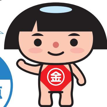
神奈川県PRキャラクター かながわキンタロウ